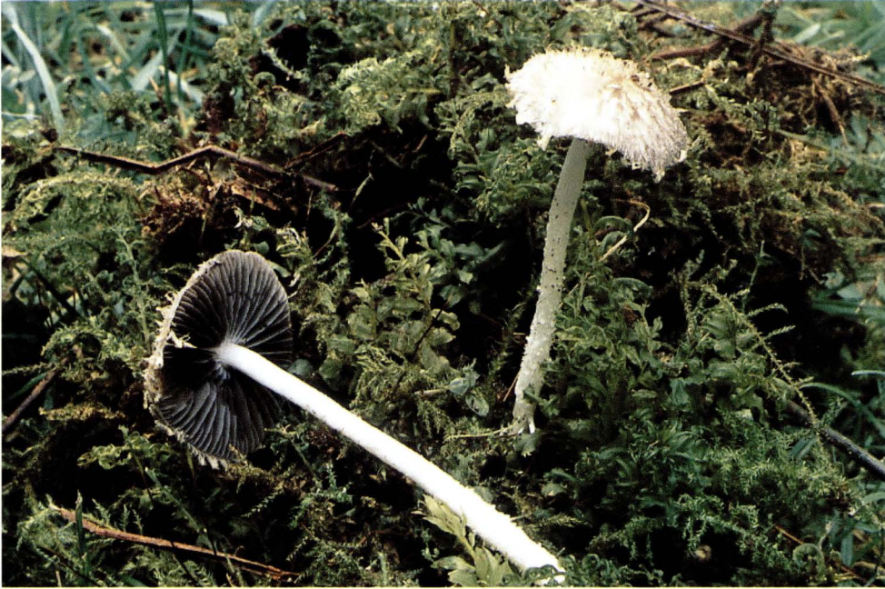
Psathyrella pervelata Kits van Wav..