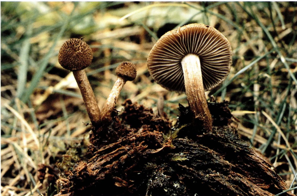
Inocybe leptophylla Atkinson.